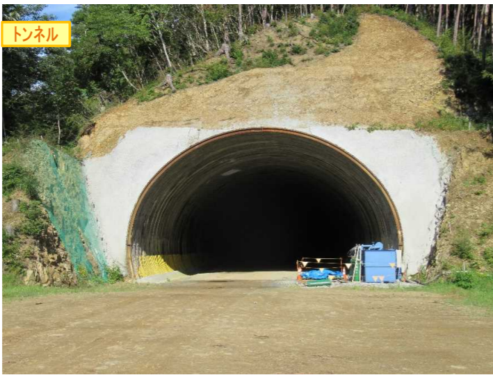
▲No350から終点側を望む [気仙沼第2号トンネル(仮)]