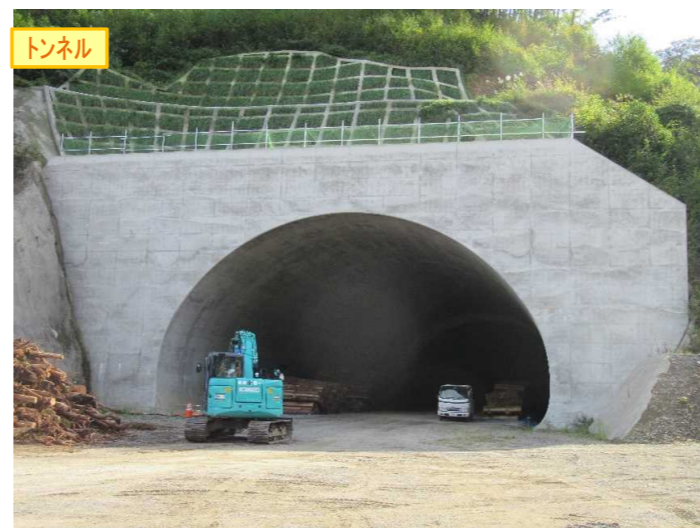
▲No410から起点側を望む [気仙沼第2号トンネル(仮)]