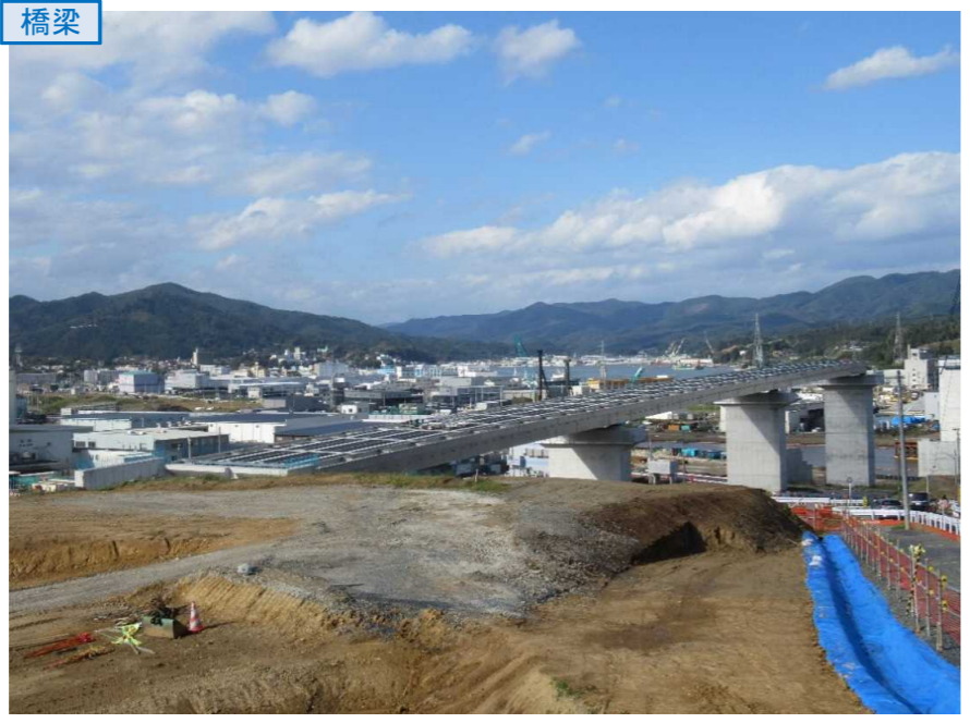
▲No.80東側から終点側を望む 〔(仮)気仙沼湾横断橋〕