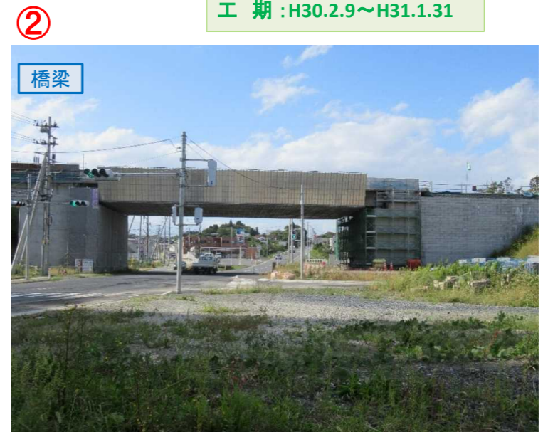
▲No.16北側から本線を望む [左: 第4号道路函渠] [右: 第3号道路函渠]