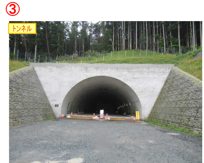
▲No.148から起点側を望む [県境トンネル(仮)]