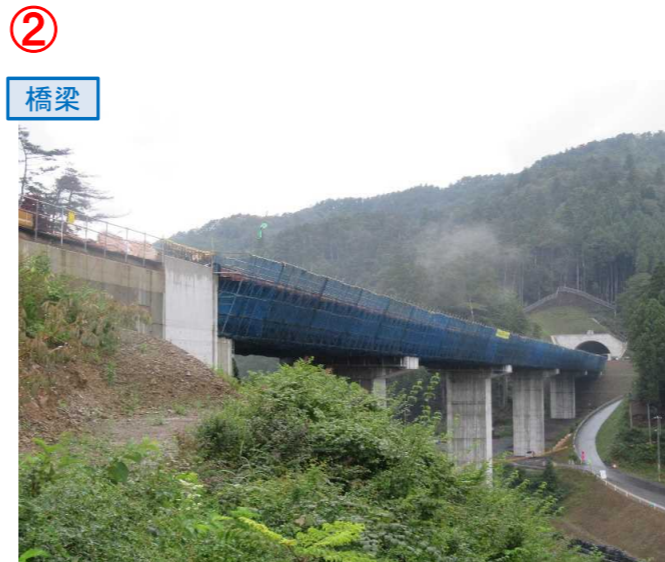
▲No.80東側から終点側を望む [青野沢川橋(仮)]