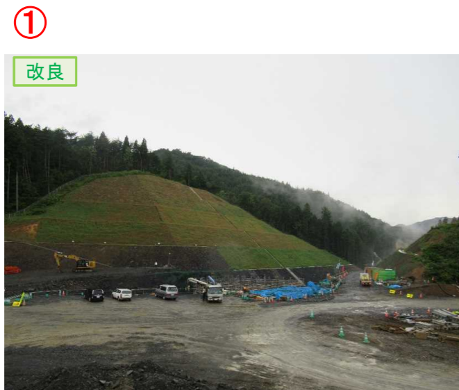
▲No.20から終点側を望む [唐桑北IC(仮)]