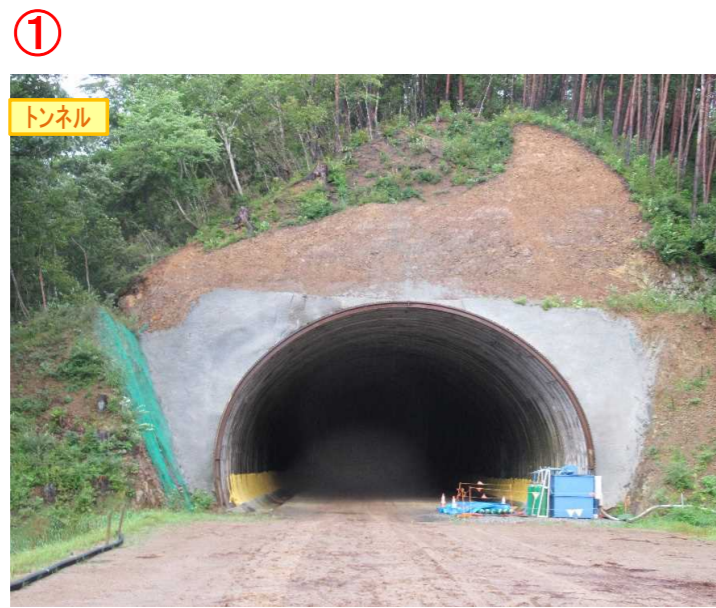
▲No350から終点側を望む [気仙沼第2号トンネル(仮)]