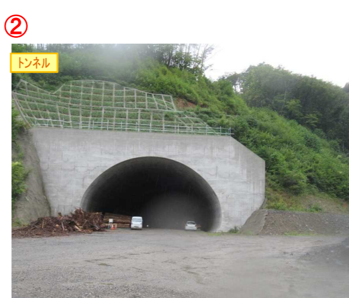
▲No410から起点側を望む [気仙沼第2号トンネル(仮)]