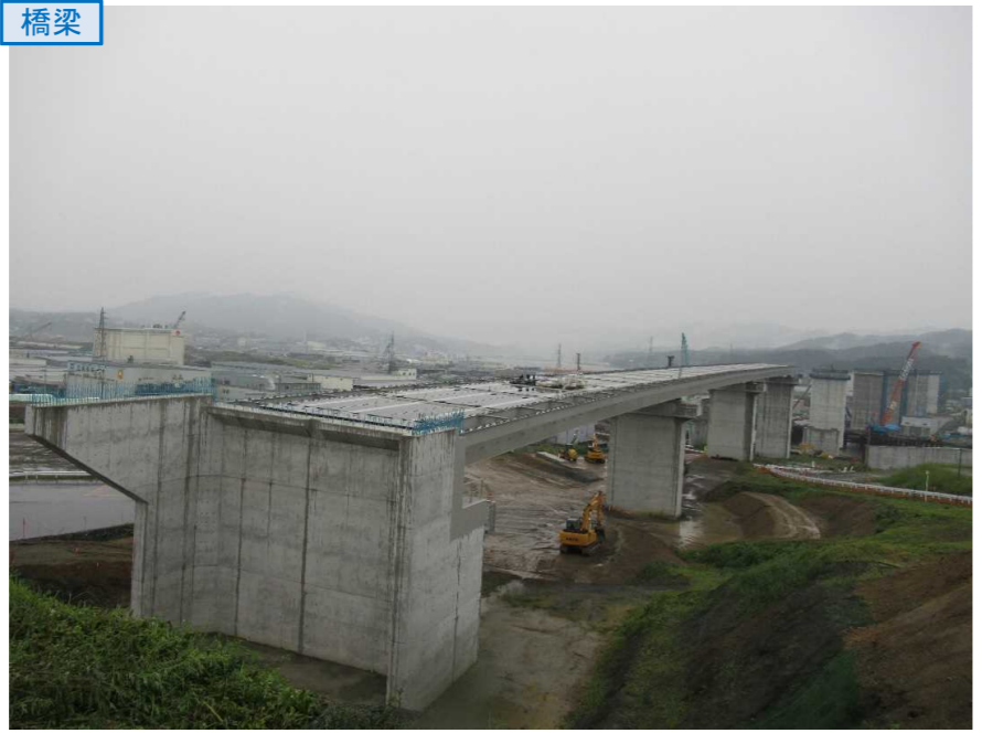
▲No.80東側から終点側を望む 〔(仮)気仙沼湾横断橋〕