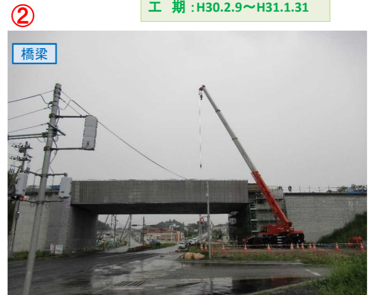
▲No.16北側から本線を望む [左: 第4号道路函渠] [右: 第3号道路函渠]