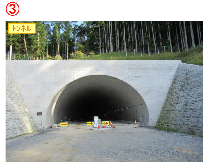
▲No.148から起点側を望む [県境トンネル(仮)]