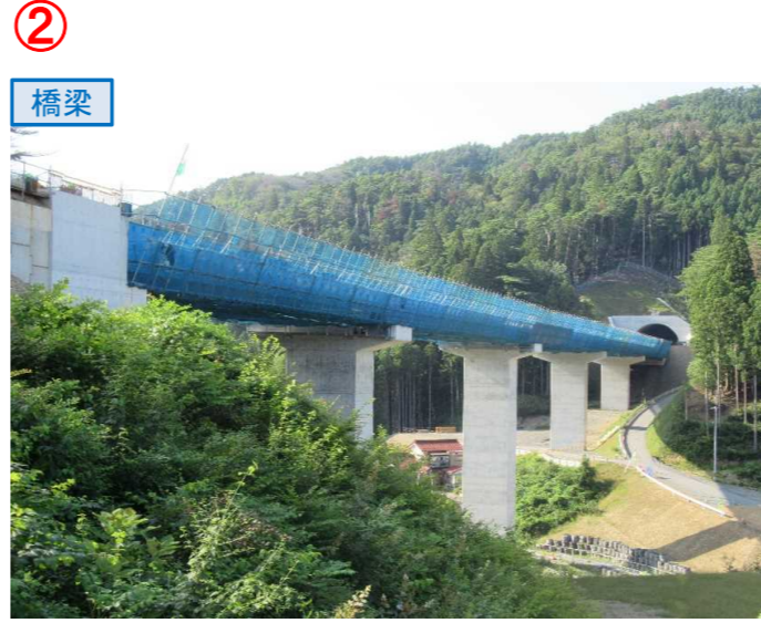
▲No.80東側から終点側を望む [青野沢川橋(仮)]