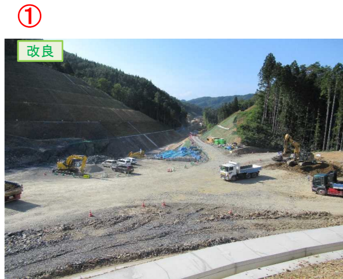
▲No.20から終点側を望む [唐桑北IC(仮)]