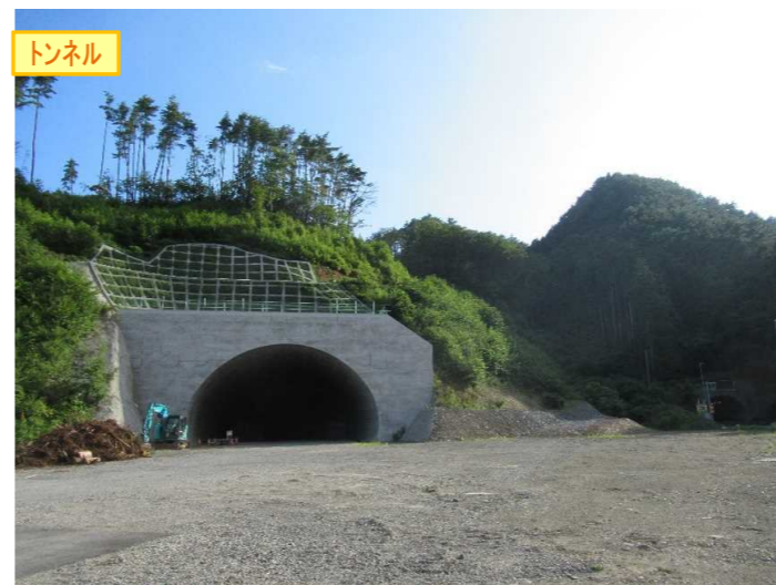
▲No410から起点側を望む [気仙沼第2号トンネル(仮)]