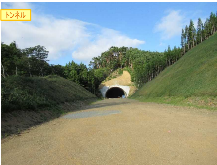
▲No350から終点側を望む [気仙沼第2号トンネル(仮)]