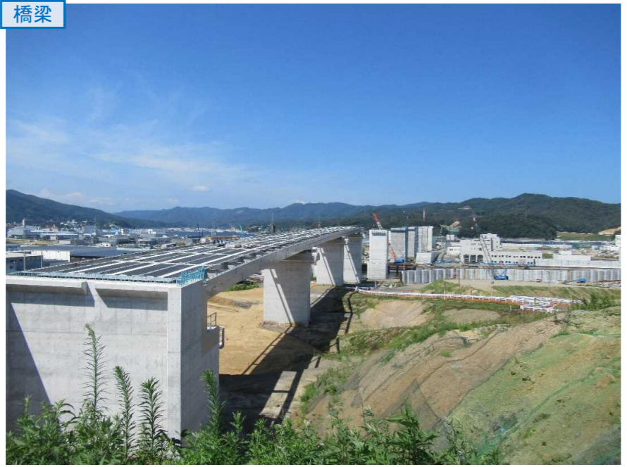
▲No.80東側から終点側を望む 〔(仮)気仙沼湾横断橋〕