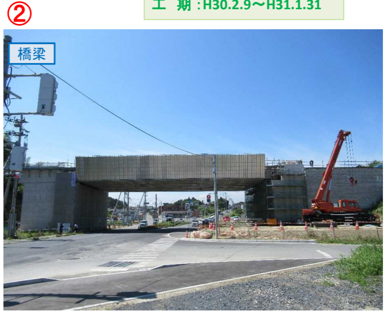
▲No.16北側から本線を望む [左: 第4号道路函渠] [右: 第3号道路函渠]