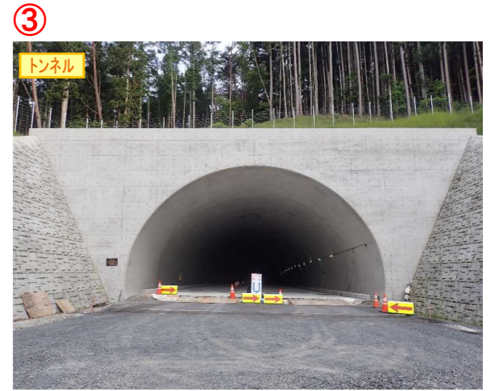
▲No.148から起点側を望む [県境トンネル(仮)]