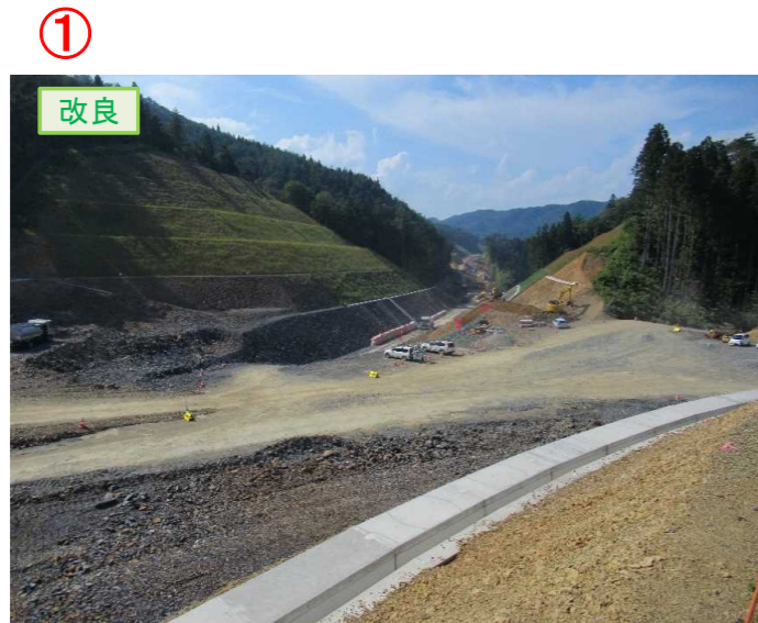
▲No.20から終点側を望む [唐桑北IC(仮)]