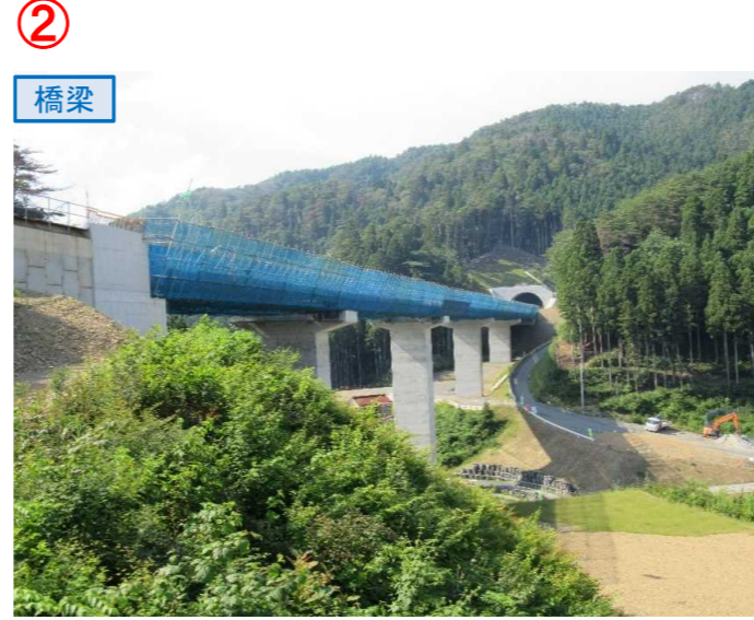
▲No.80東側から終点側を望む [青野沢川橋(仮)]