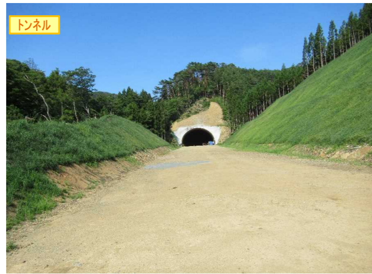
▲No350から終点側を望む [気仙沼第2号トンネル(仮)]