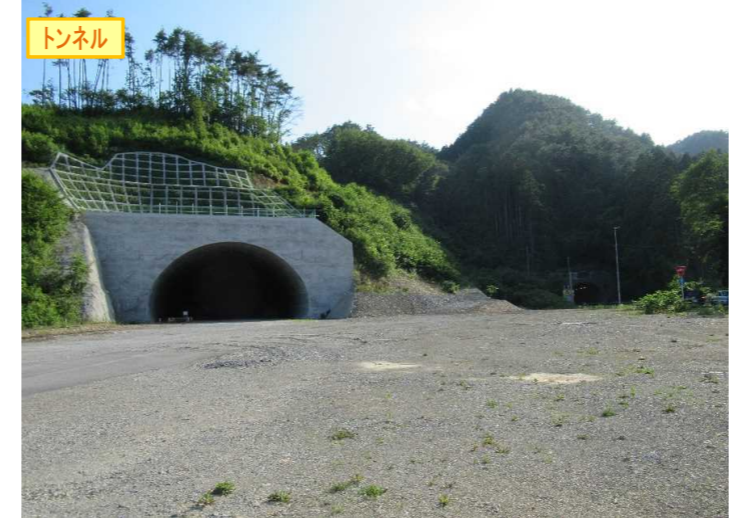
▲No410から起点側を望む [気仙沼第2号トンネル(仮)]