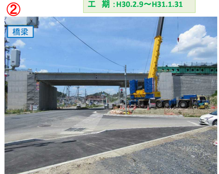
▲No.16北側から本線を望む [左: 第4号道路函渠] [右: 第3号道路函渠]