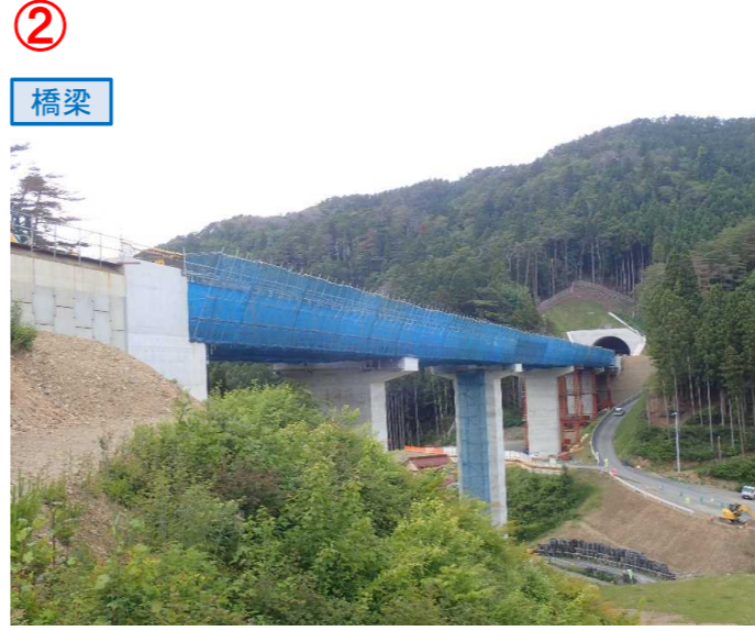
▲No.80東側から終点側を望む [青野沢川橋(仮)]