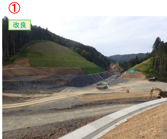
▲No.20から終点側を望む [唐桑北IC(仮)]