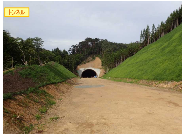
▲No350から終点側を望む [気仙沼第2号トンネル(仮)]