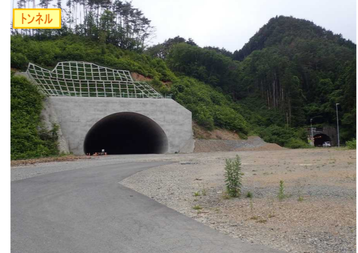
▲No410から起点側を望む [気仙沼第2号トンネル(仮)]