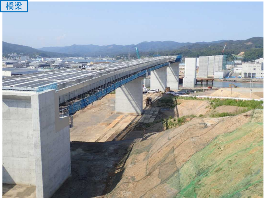
▲No.80東側から終点側を望む 〔(仮)気仙沼湾横断橋〕