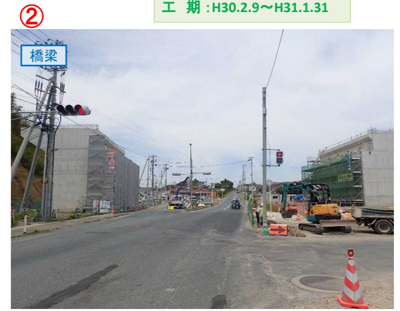
▲No.16北側から本線を望む [左: 第4号道路函渠] [右: 第3号道路函渠]