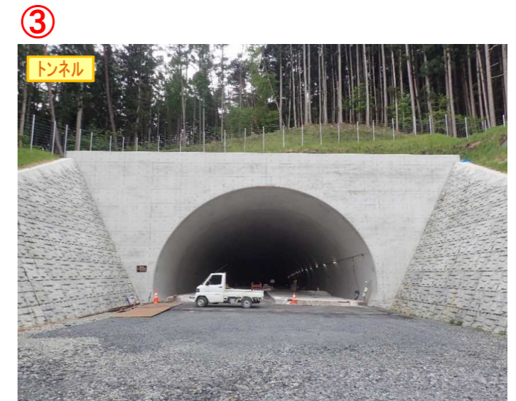
▲No.148から起点側を望む [県境トンネル(仮)]