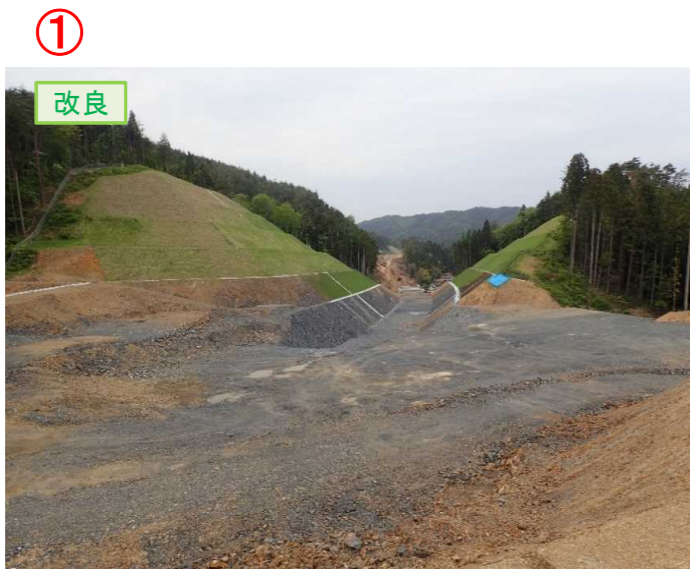
▲No.20から終点側を望む [唐桑北IC(仮)]