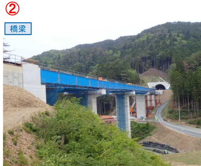
▲No.80東側から終点側を望む [青野沢川橋(仮)]