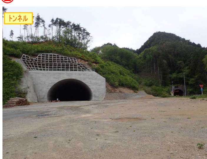
▲No410から起点側を望む [気仙沼第2号トンネル(仮)]