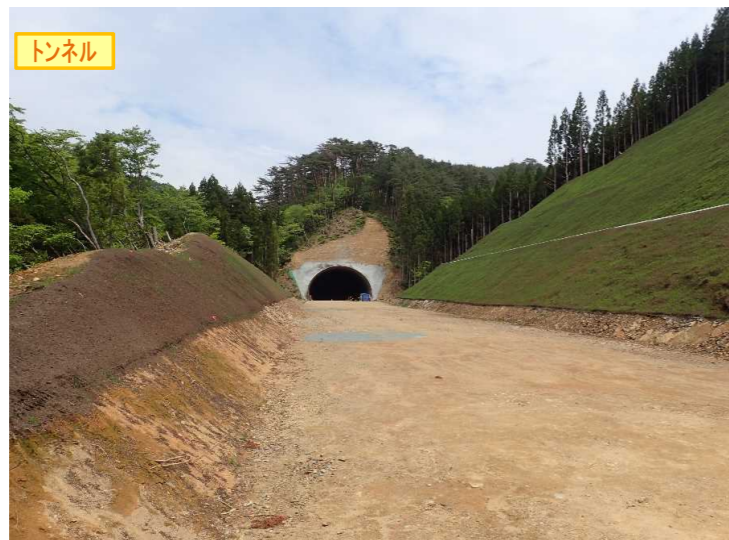
▲No350から終点側を望む [気仙沼第2号トンネル(仮)]