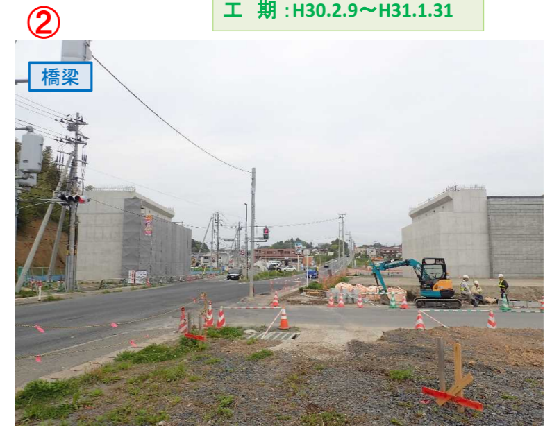
▲No.16北側から本線を望む [左:第4号道路函渠] [右:第3号道路函渠]