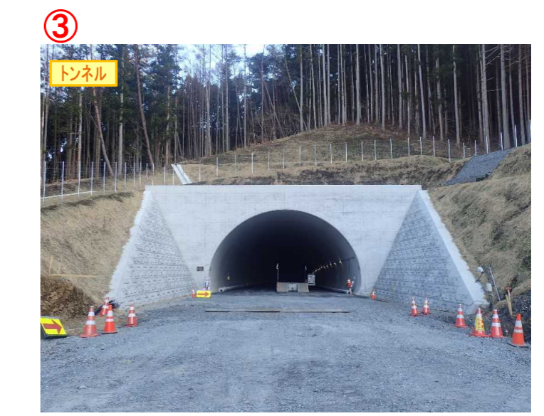
▲No.148から起点側を望む [県境トンネル(仮)]