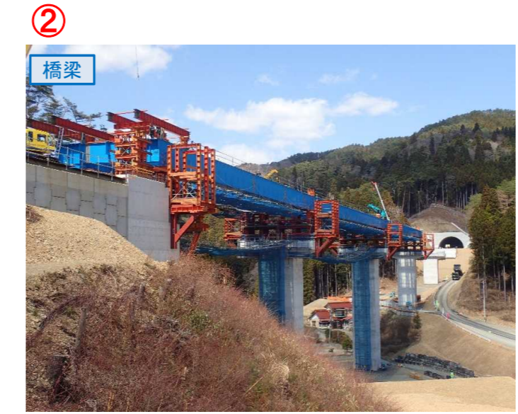
▲No.80東側から終点側を望む [青野沢川橋(仮)]