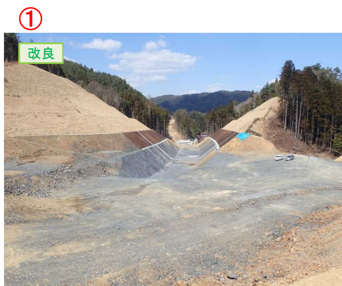
▲No.20から終点側を望む [唐桑北IC(仮)]