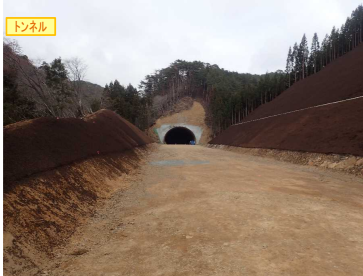
▲No350から終点側を望む [気仙沼第2号トンネル(仮)]