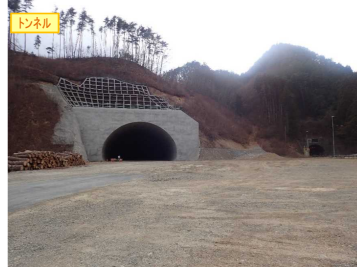
▲No410から起点側を望む [気仙沼第2号トンネル(仮)]