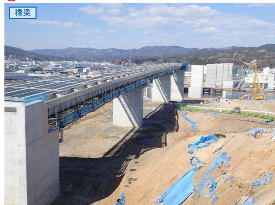
▲No.80東側から終点側を望む [気仙沼湾横断橋(仮)]