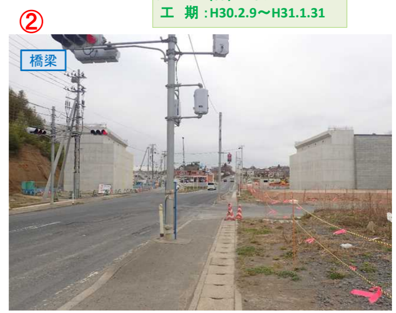
▲No.16北側から本線を望む [左: 第4号道路函渠] [右: 第3号道路函渠]