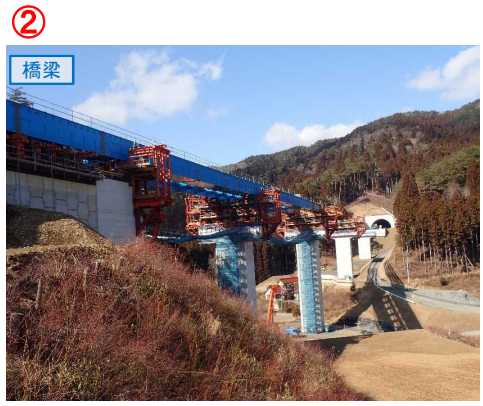
▲No.80東側から終点側を望む [青野沢川橋(仮)]