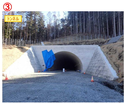
▲No.148から起点側を望む [県境トンネル(仮)]