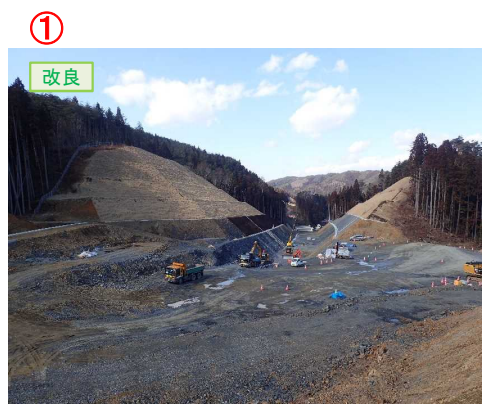
▲No.20から終点側を望む [唐桑北IC(仮)]