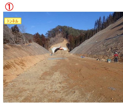
▲No350から終点側を望む [気仙沼第2号トンネル(仮)]