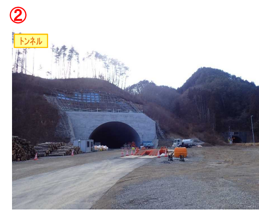
▲No410から起点側を望む [気仙沼第2号トンネル(仮)]