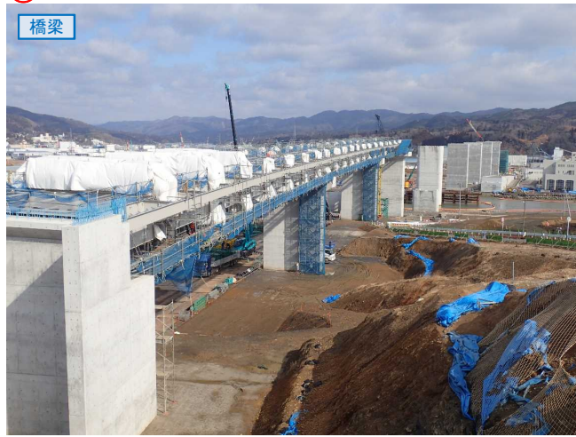
▲No.80東側から終点側を望む 〔気仙沼湾横断橋(仮)〕