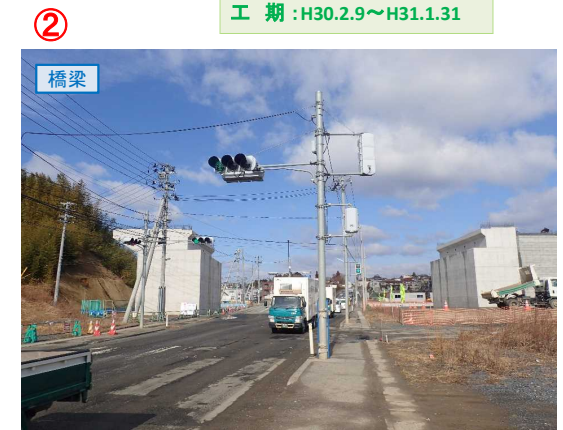
▲No.27南側から本線を望む [片浜跨道橋(仮)]