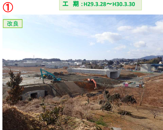
▲No.16北側から本線を望む [左：第4号道路函渠 右：第3号道路函渠]

松崎北沢地区道路改良工事 受注者：(株)只野組 工期：H30.2.9～H31.1.31