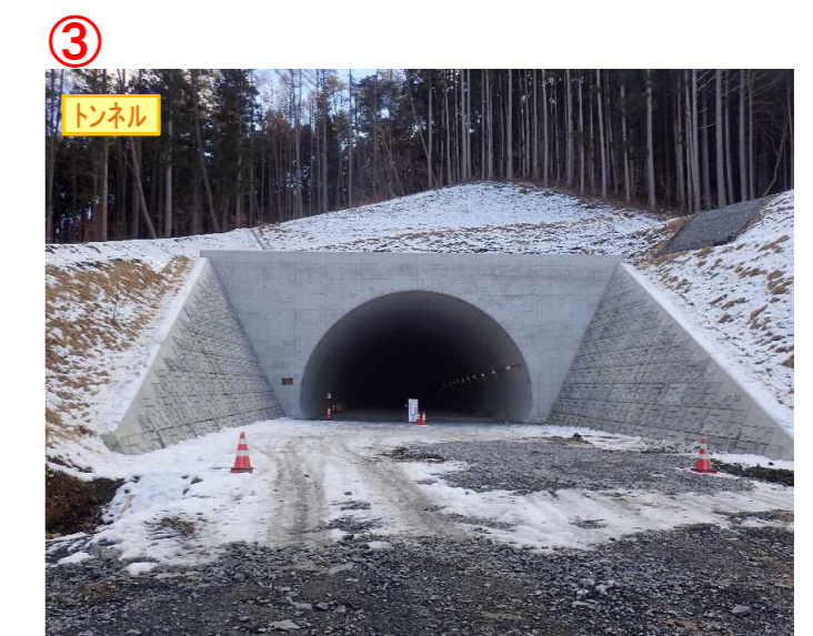
▲No.148から起点側を望む [県境トンネル(仮)]