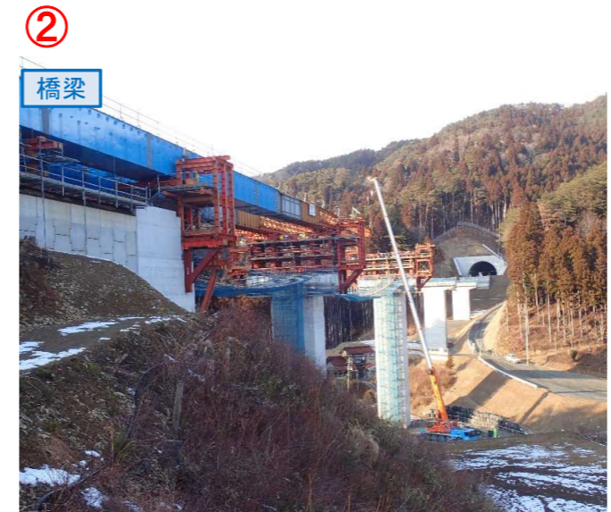
▲No.80東側から終点側を望む [青野沢川橋(仮)]