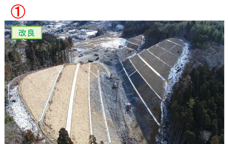
▲No.30から起点側を望む [唐桑北IC(仮)]