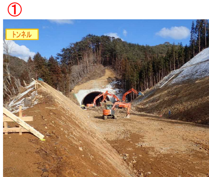
▲No350から終点側を望む [気仙沼第2号トンネル(仮)]