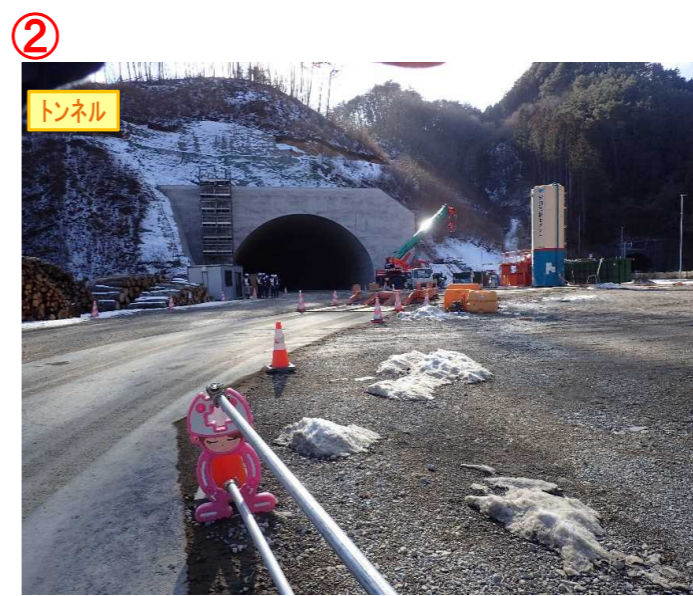
▲No410から起点側を望む [気仙沼第2号トンネル(仮)]