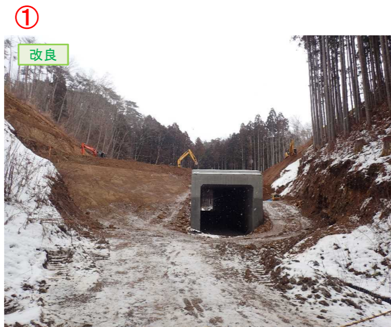
▲No.210西側から本線側に望む [第11号道路函渠]