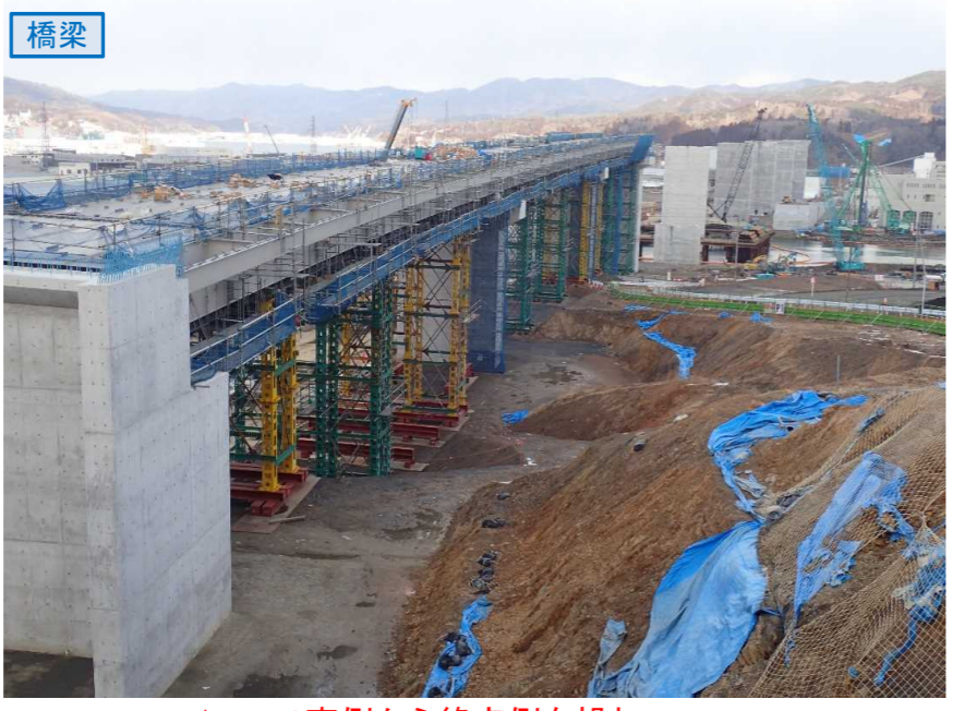
▲No.80東側から終点側を望む [気仙沼湾横断橋(仮)]