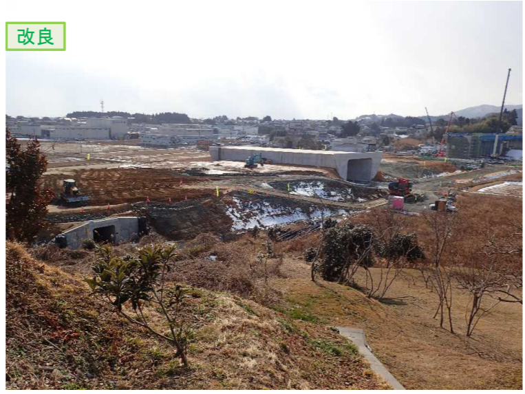
▲No.16北側から本線を望む [左: 第4号道路函渠] [右: 第3号道路函渠]

① 松崎地区道路改良工事 受注者: (株)只野組 工期: H29.3.28～H30.3.30