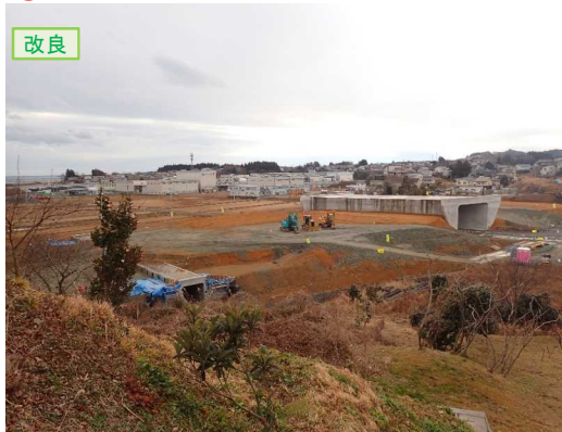
▲No.16北側から本線を望む [左: 第4号道路函渠] [右: 第3号道路函渠]

① 松崎地区道路改良工事 受注者: (株)只野組 工期: H29.3.28～H30.3.30