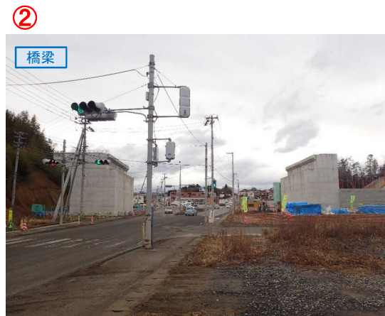
▲No.27南側から本線を望む [片浜跨道橋(仮)]