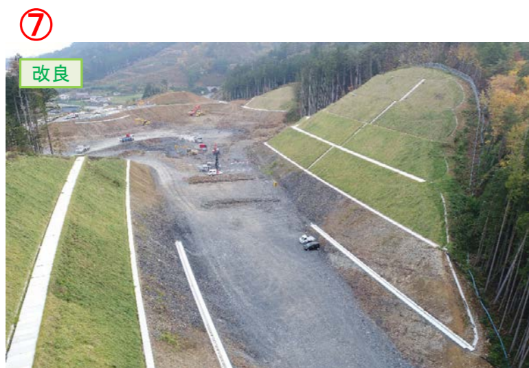
▲No.30から起点側を望む [唐桑北IC(仮)]