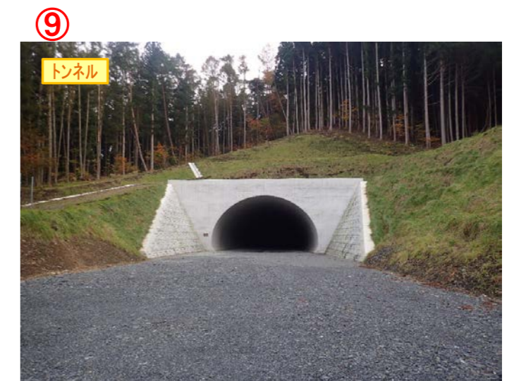
▲No.148から起点側を望む [県境トンネル(仮)]