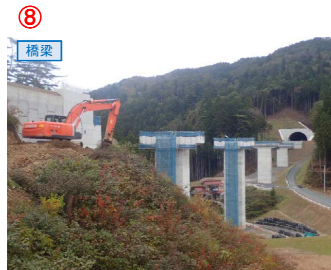
▲No.80東側から終点側を望む [青野沢川橋(仮)]