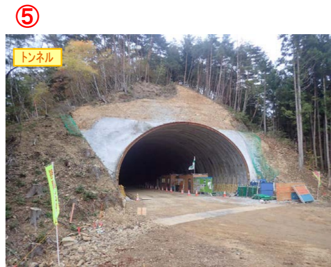
▲No350から終点側を望む [気仙沼第2号トンネル(仮)]