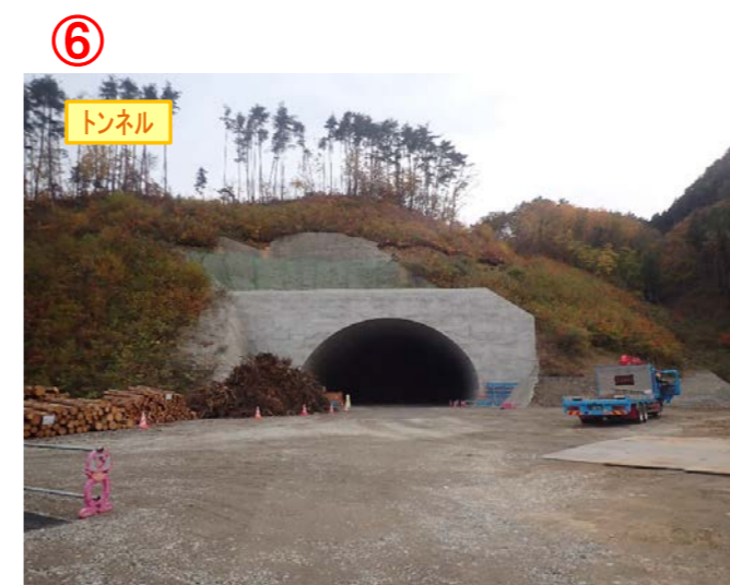
▲No410から起点側を望む [気仙沼第2号トンネル(仮)]