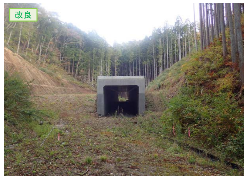
▲No.210西側から本線側に望む [第11号道路函渠]