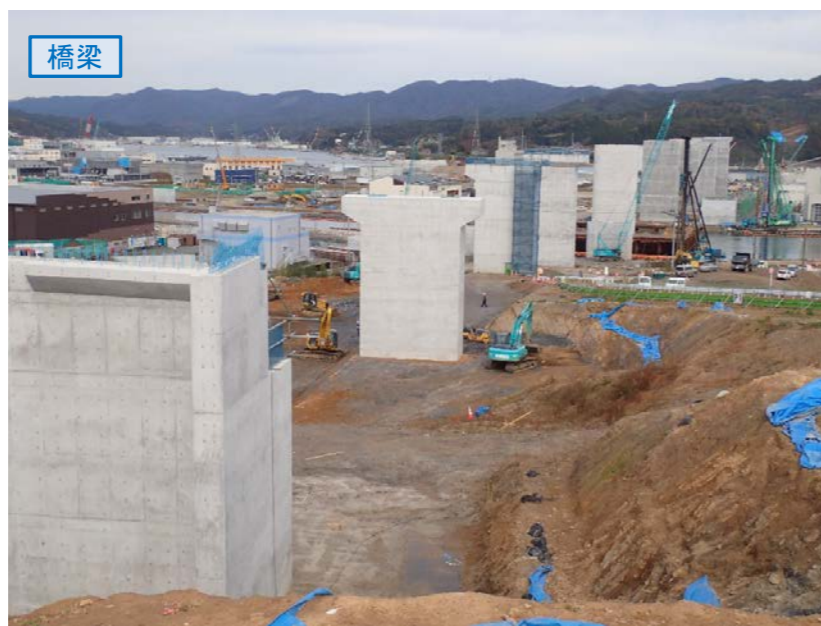
▲No.80東側から終点側を望む [気仙沼湾横断橋(仮)]