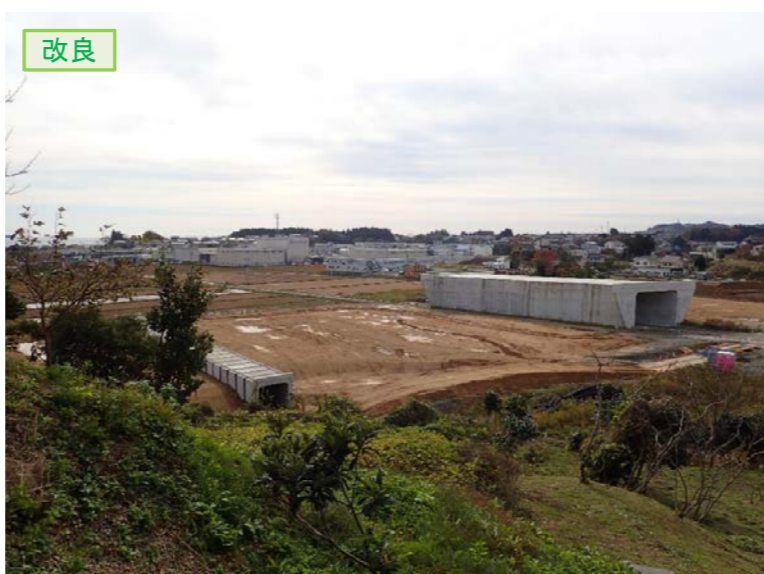
▲No.16北側から本線を望む [左:第4号道路函渠] [右:第3号道路函渠]