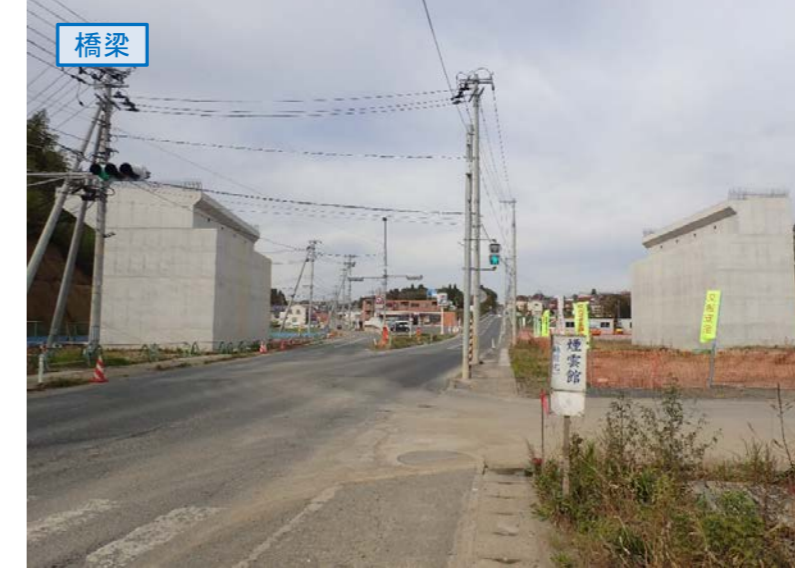
▲No.27南側から本線を望む [片浜跨道橋(仮)]