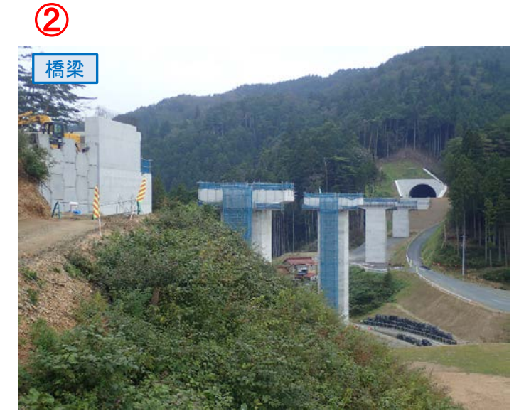
▲No.80東側から終点側を望む [青野沢川橋(仮)]