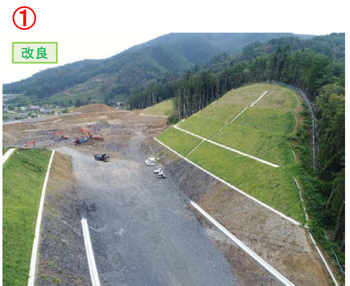
▲No.30から起点側を望む [唐桑北IC(仮)]