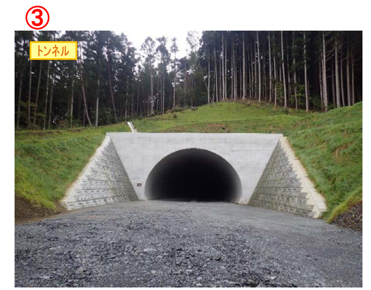
▲No.148から起点側を望む [県境トンネル(仮)]