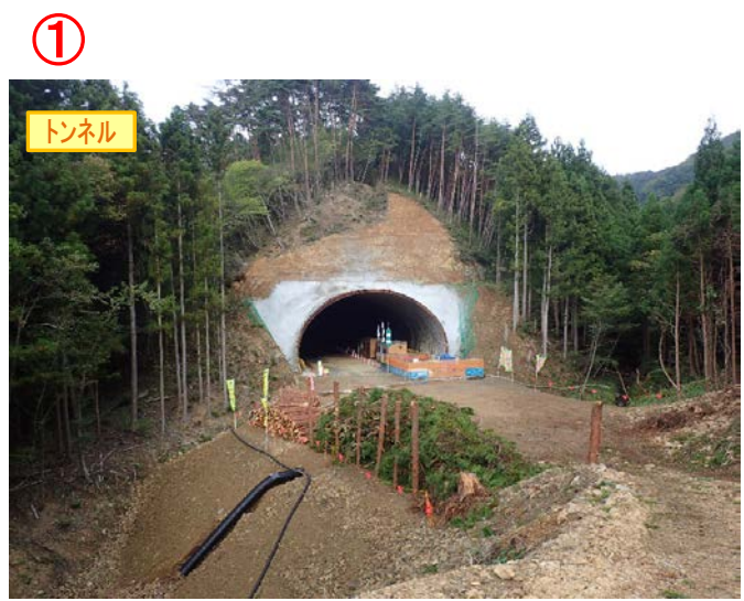
▲No350から終点側を望む [気仙沼第2号トンネル(仮)]