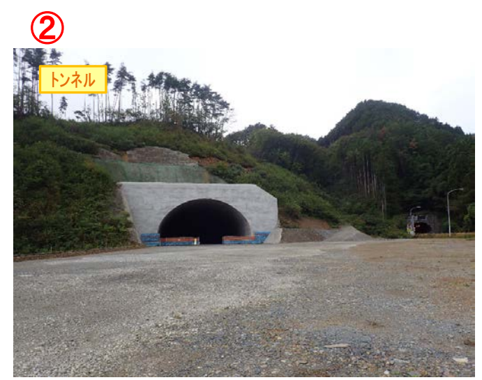
▲No410から起点側を望む [気仙沼第2号トンネル(仮)]