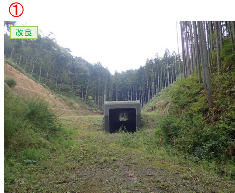
▲No.210西側から本線側に望む [第11号道路函渠]