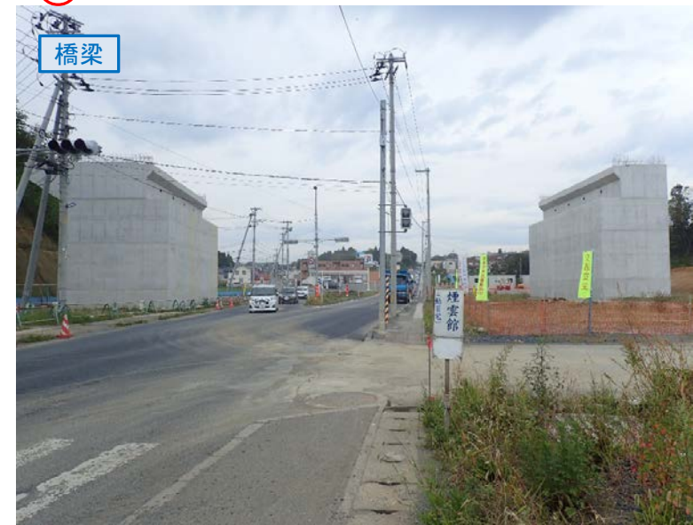
▲No.27南側から本線を望む [片浜跨道橋(仮)]