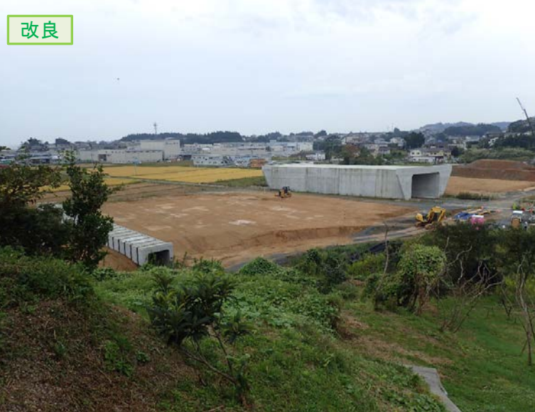
▲No.16北側から本線を望む [左:第4号道路函渠] [右:第3号道路函渠]