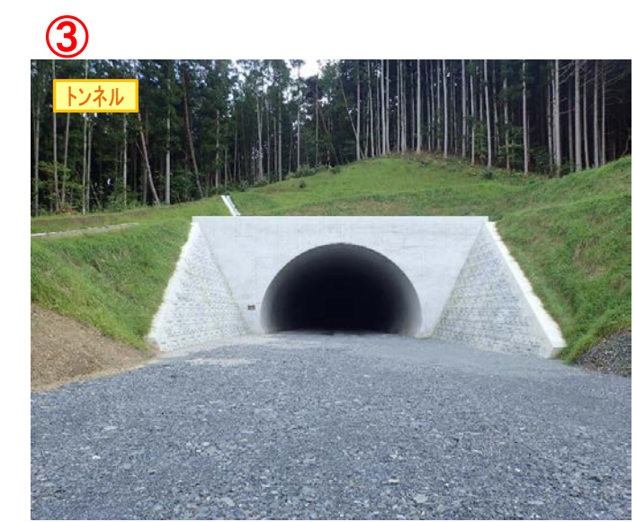
▲No.148から起点側を望む [県境トンネル(仮)]