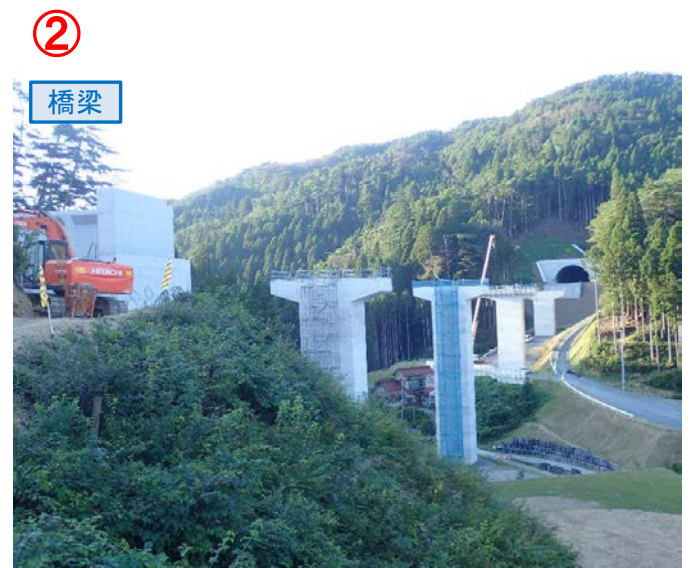
▲No.80東側から終点側を望む [青野沢川橋(仮)]