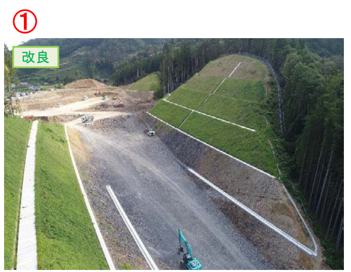
▲No.30から起点側を望む [唐桑北IC(仮)]