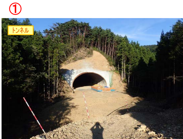
▲No350から終点側を望む [気仙沼第2号トンネル(仮)]