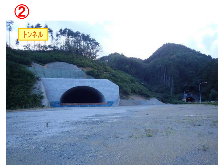
▲No410から起点側を望む [気仙沼第2号トンネル(仮)]