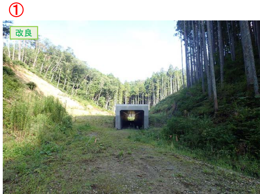
▲No.210西側から本線側に望む [第11号道路函渠]