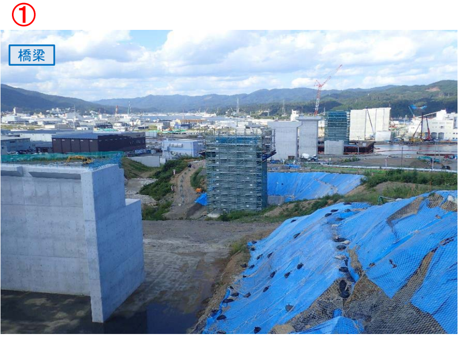
▲No.80東側から終点側を望む [気仙沼湾横断橋(仮)]