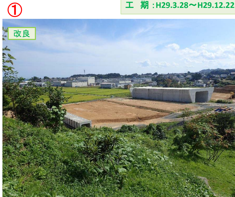
▲No.16北側から本線を望む [左:第4号道路函渠] [右:第3号道路函渠]

松崎地区道路改良工事 受注者:(株)只野組 工期:H29.3.28～H29.12.22