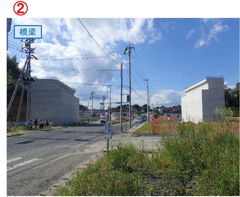
▲No.27南側から本線を望む [片浜跨道橋(仮)]