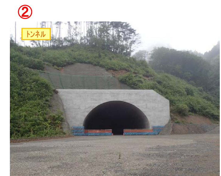
▲No410から起点側を望む [気仙沼第2号トンネル(仮)]