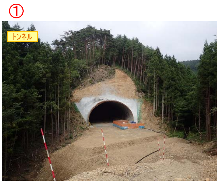
▲No350から終点側を望む [気仙沼第2号トンネル(仮)]